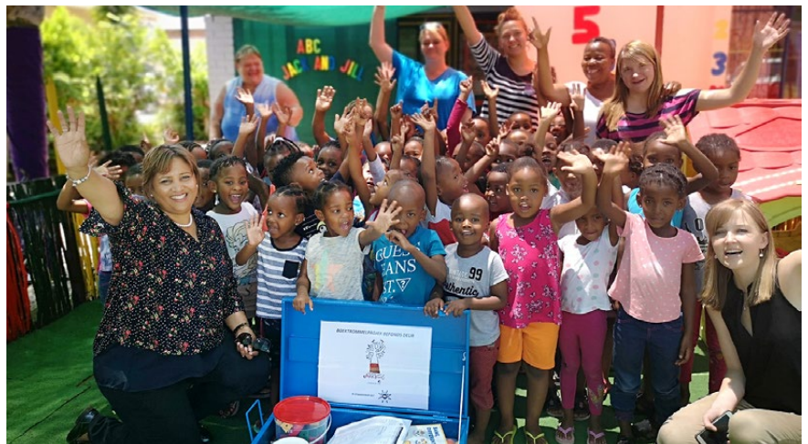
Die kinders is baie opgewonde oor die boektrommel