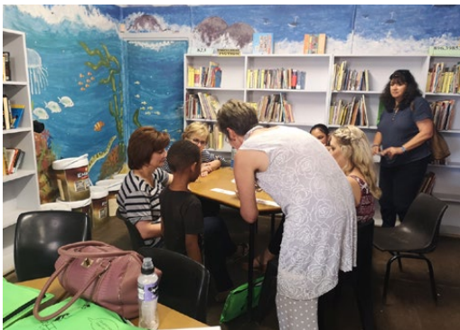
Opvoeders demonstreer die leesprogram in Prins Albert

Die VVA kon ook aan die skool nog ekstra leesboeke skenk, aangesien die skool reeds in 2015 'n boektrommel ontvang het.